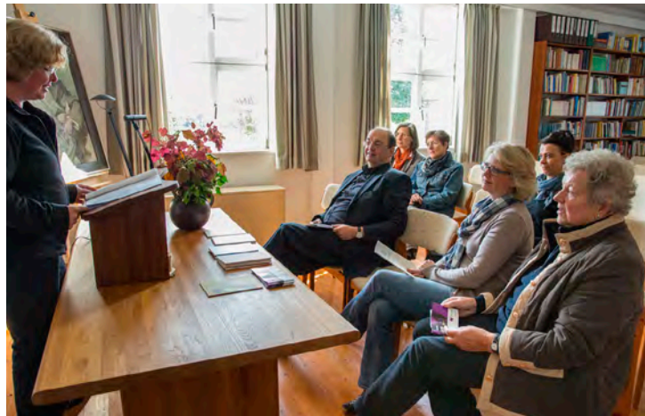
Impressionen aus dem Hille-Haus, Nieheim-Erwitten