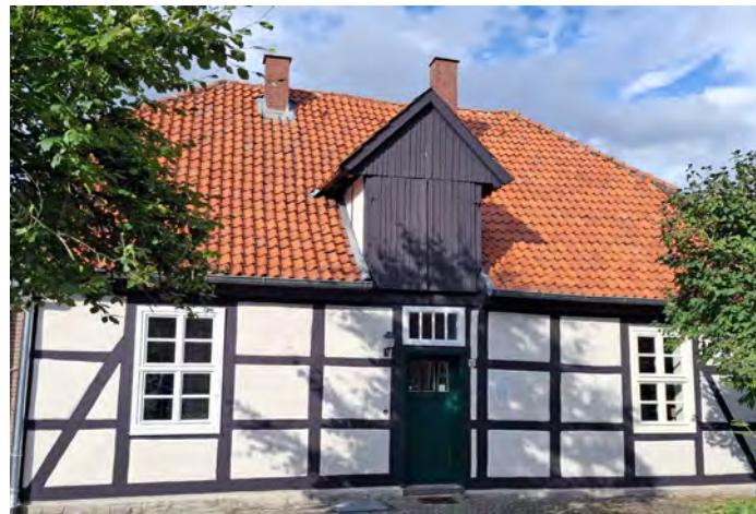
Impressionen aus dem Hille-Haus, Nieheim-Erwitzen